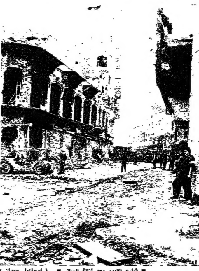
شارع ابيهم بعد ازالة السور

كول رجب بقمه شولتر - غروميكو رئيسة وزراء بريطانيا بدأت محادثات رسمية في لبون (رامزي بركة) مع وزير الخارجية البريطاني غروميكو.